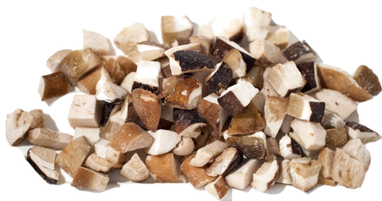
FUNGHI PORCINI A CUBETTI