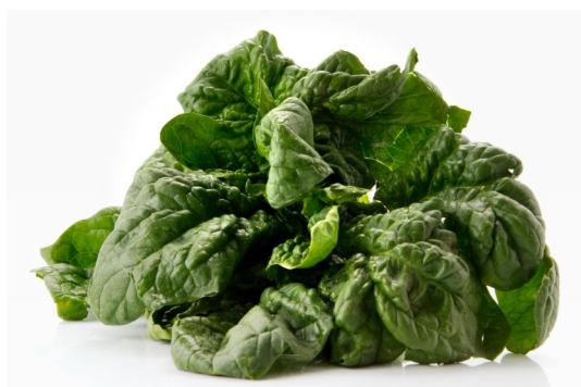
SPINACI IN FOGLIA O CUBETTI