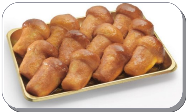
BABA' MONOPORZIONE IMBALLO: PZ 12