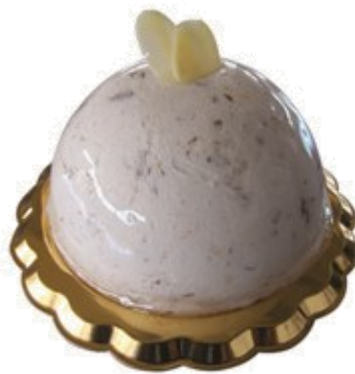
PARFAIT DI MANDORLE