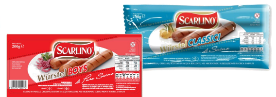
CLASSICO I PURO