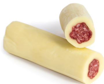
FILAMELLA GR 500