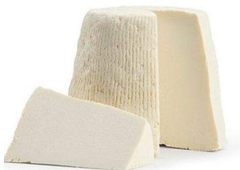
RICOTTA SALATA GR 500 - 1000