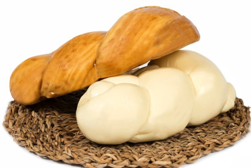
TRECCIA AFFUMICATA O FRESCA KG 2/3