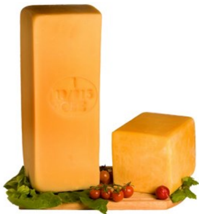
CACIOCAVALLO SEMISTAGIONATO E STAGIONATO