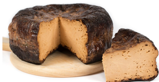
RICOTTA AL FORNO GR 500 - 1000