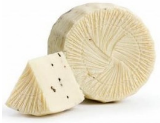
PRIMOSALE SICILIANO BIANCO, PISTACCHIO, PEPE NERO, PEPE ROSSO GR 500 - 1000