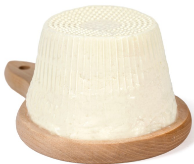
RICOTTA FRESCA DI PECORA O VACCINA