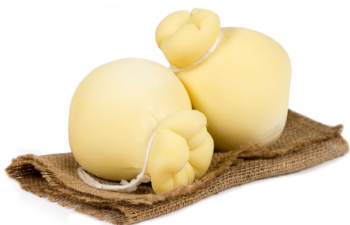
PROVOLETTA FRESCA GR 500